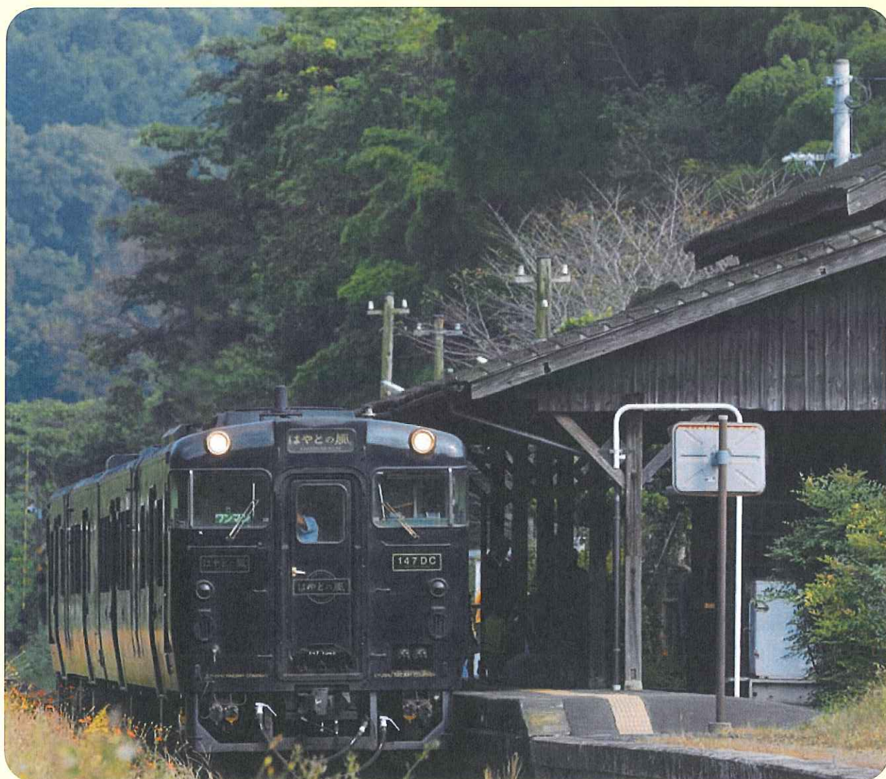
(嘉例川駅「はやとの風」)