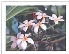
※画像をクリックすると拡大画像が表示されます。