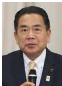
小園県議会副議長