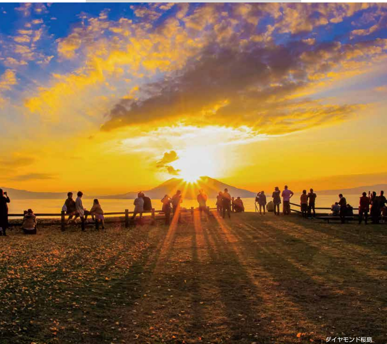
ダイヤモンド桜島