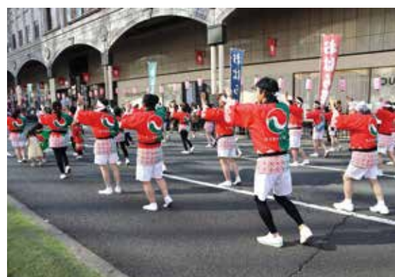
新しいハッピーでPR