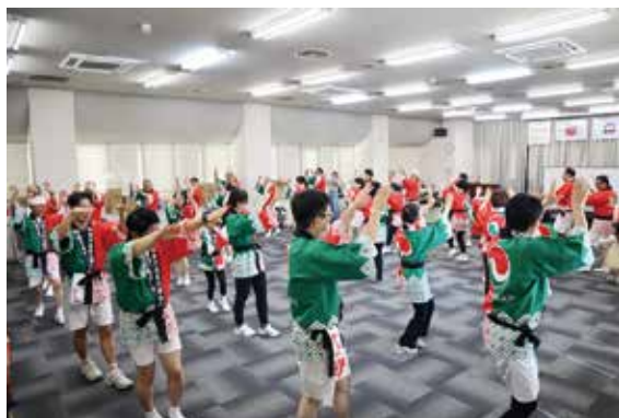
出発前の練習の様子

宅建協会も鹿児島北支部・鹿児島南支部が主体となり、48名（男性30名、女性18名）で3日の午後の部に参加しました。秋晴れの中、新しいデザインのハッピーを身にまとい、限られた時間の中で練習してきた息の合った踊りを披露し、宅建協会・ハトマークをPRしました。