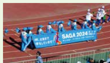
次回開催の佐賀県へ