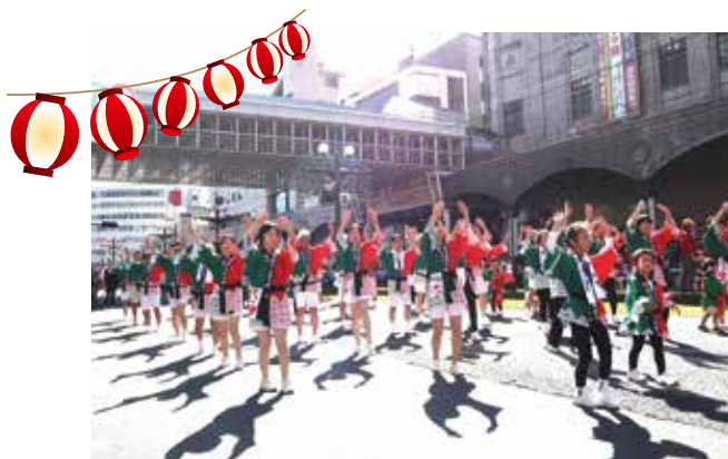
子供たちも一緒に息の合った踊りです