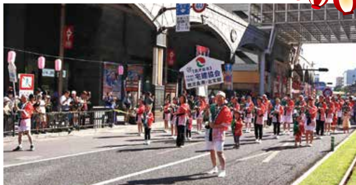
会長を先頭に、太陽を背にしてスタート