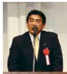
園田宅建調査会会長