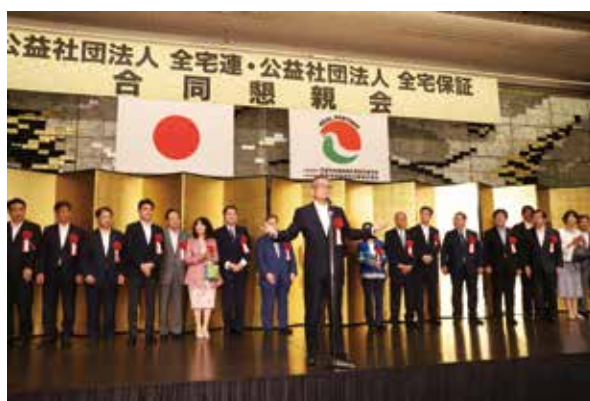
合同懇親会 来賓（国会議員）の皆様