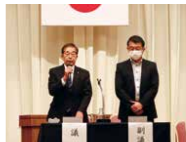
須部議長と中島副議長