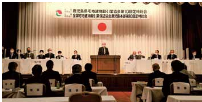
中馬会長（本部長）のあいさつ