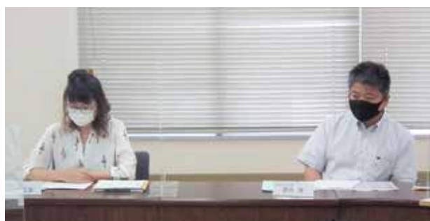
山迫ブロック長、倉内ブロック長