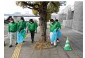
国分シビックセンター周辺