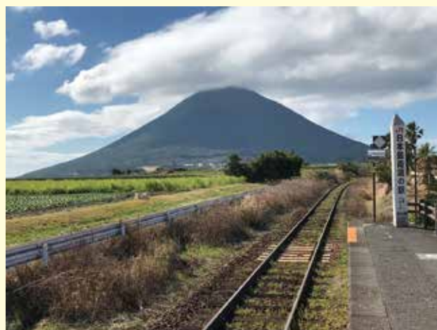
ホームから開聞岳を一望できる JR日本最南端の駅「西大山駅」

頂上から臨む大パノラマは圧巻で、北の霧島、桜島、池田湖、南の屋久島、三島と、鹿児島県の観光名所を一度に味わうことができます。