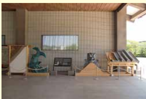
黎明館の玄関に御楼門と同じ鬼瓦や鯨のレプリカなどが展示されています。

御楼門焼失前の明治初期に撮影された古写真の解析や、現存する礎石に残る柱の痕跡などから、御楼門の大きさは高さ・幅ともに約20mもある国内最大の武家門であったものとされています。この御楼門の復元に官民一体となって取り組みを進め、今年3月31日に完成、4月11日から一般公開されました。