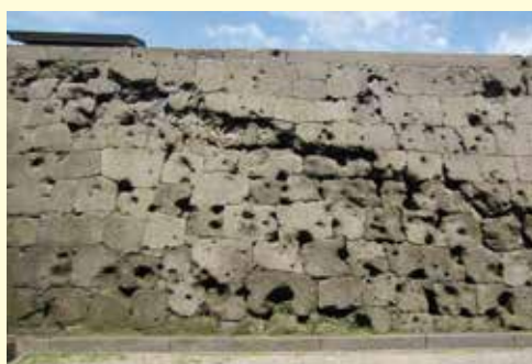
御楼門の奥に見える城壁の弾痕が西南戦争の激戦を物語っています。

御楼門復元には、民間の「鶴丸城御楼門復元実行委員会」と鹿児島県が、平成27年に「鶴丸城御楼門建設協議会」を設立し、史実等に基づき再現するための調査や資料収集、礎石などの遺構を保全する取り組みや耐震・強度を十分に保つための工夫がなされています。