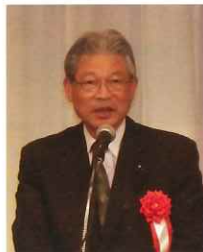
外園県議会議員代理 桑鶴県議会副議長