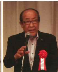
田之上自民党県議団 宅地建物調査会会長