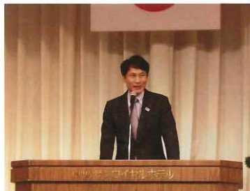
三反園知事の祝辞

定款改正は、総正会員の3分の2以上の賛成が必要で非常にハードルが高く、今回の第2号議案について、採決の結果、賛成3分の2に僅かに足りず成立に至りませんでした。