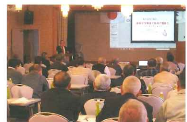
牧野副支部長の説明