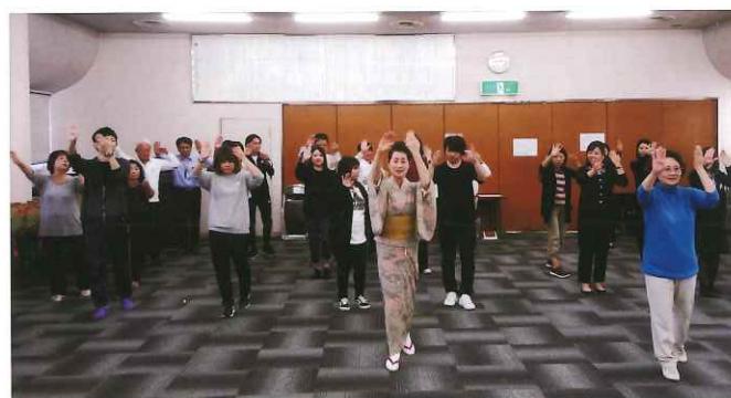
皆さん熱心に練習されました