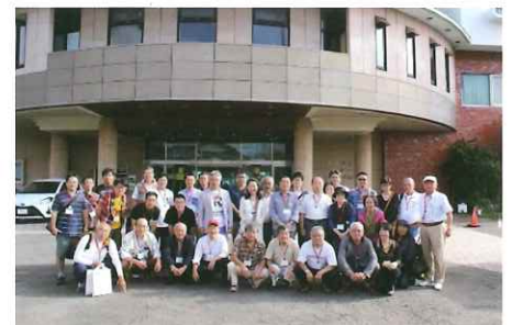
青島グランドホテルにて