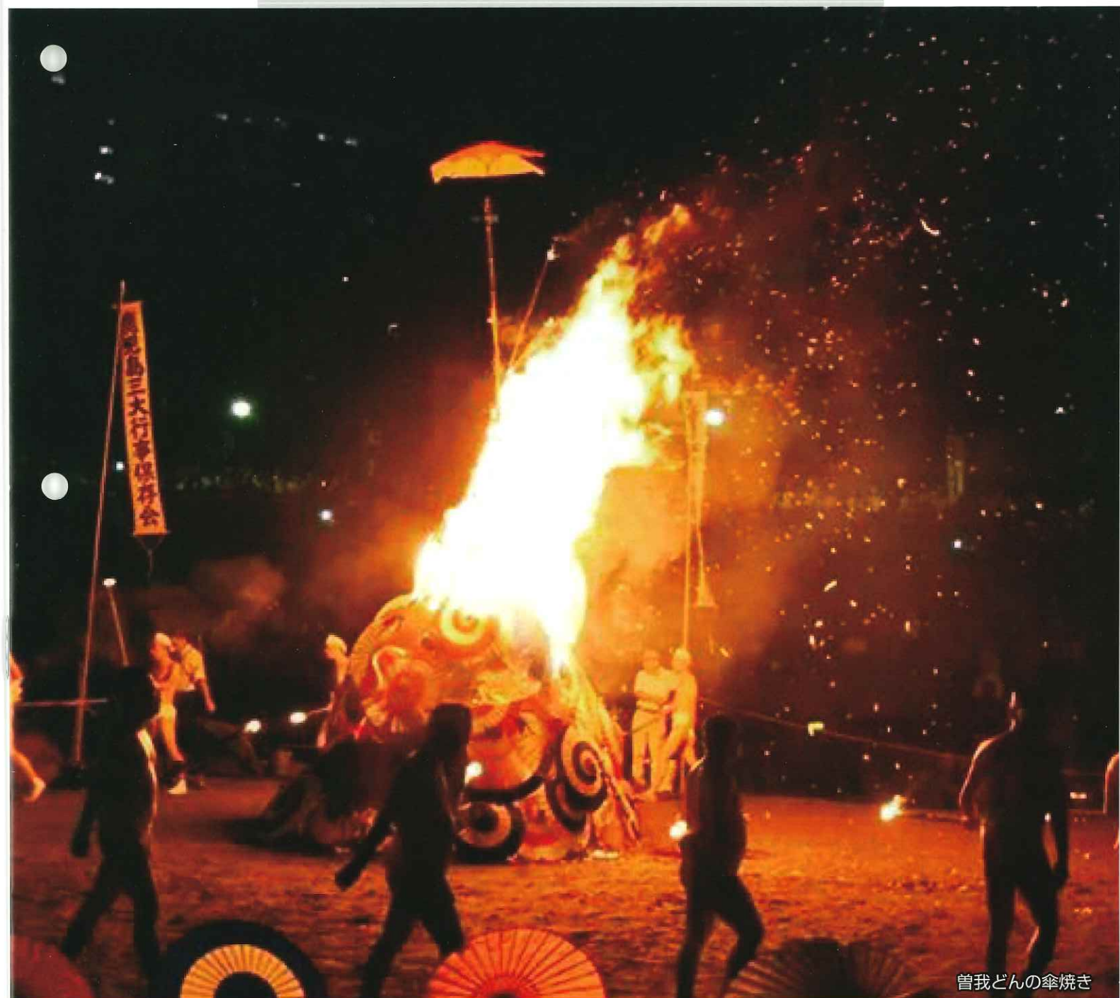
曾我どんの傘焼き