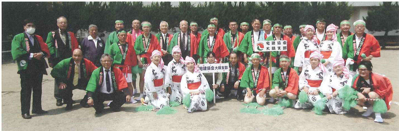
参加された皆さん、お疲れさまでした