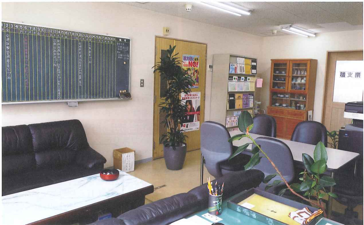
不動産会館ビル5階に移転後の支部事務所