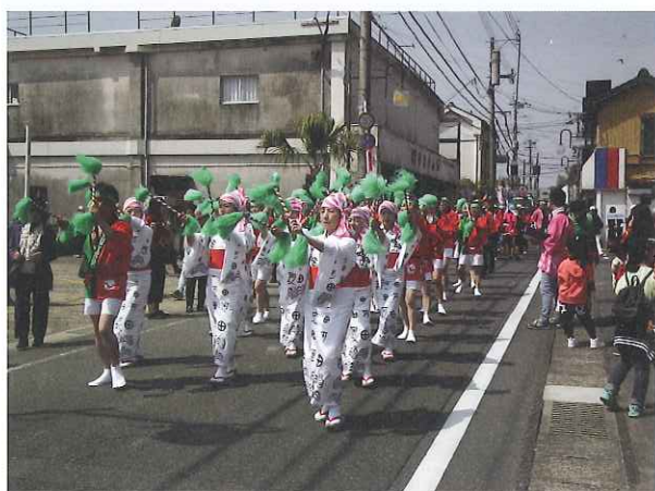
息の合った踊りです